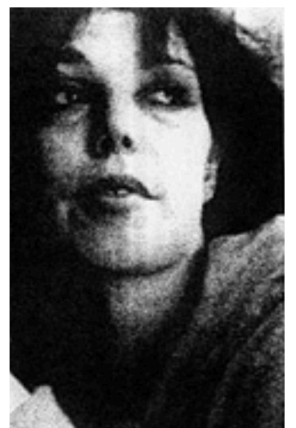
"Laurence", image du film "Galère de femmes" de Jean-Michel Carré 1993/les films du Grain de Sable